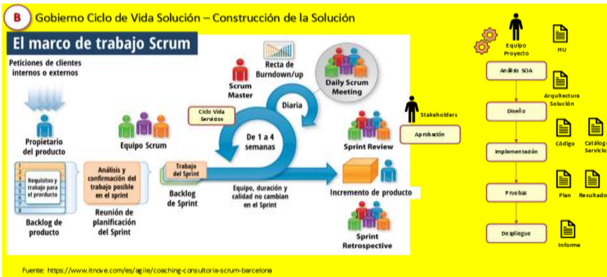
Ilustración. Modelo de Construcción de la solución. Adaptado de www.itnova.com .

El modelo de construcción propuesto involucra la adopción de metodologías ágiles como SCRUM dentro de los requerimientos de FOGACOOOP para la construcción de soluciones SOA, esto debido a ventajas como la agilidad de producto, el tiempo a mercado y la consecución de valor de manera temprana.